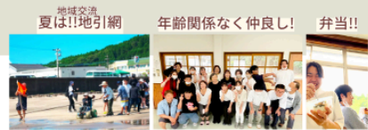
地域交流 夏は!! 地引網 年齢関係なく仲良し! 弁当!!

宮崎保健福祉専門学校 @miyazakihokenfukushi 宮崎保健福祉学校